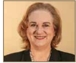
GWEN L. GABLE GATEway