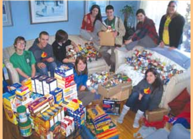
Les Lambeth Junior Optimists d'Ontario ont reçu tellement de dons qu'ils ont du mal à trouver des endroits où s'asseoir dans leur poste de commandement de la collecte.

Si votre club OJOI a participé, mais n'a toujours pas fait rapport des montants recueillis, qu'attend-il? Faites rapport à Souper Bowl of Caring dès que possible!