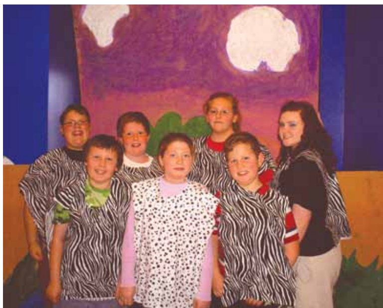
Les membres du FYI Junior Optimist montrent fièrement les costumes qu'ils porteront à l'occasion des représentations de Zink le zèbre .

Depuis que le FYI Junior Optimist Club de Fairbury, Nebraska, a choisi de travailler sur Zink le zèbre , l'automne dernier, les membres se sont lancés dans le projet pieds et poings liés.