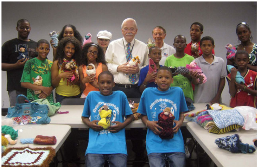
Les membres OJOI et les Optimistes semblent très attachés à leurs petits cadeaux – les enfants hospitalisés les aimeront certes tout autant!