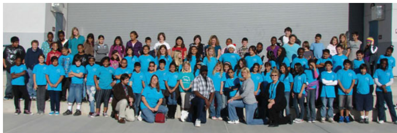
Les JOOI-ful Jets font œuvre utile au sein de leur école depuis le premier jour.