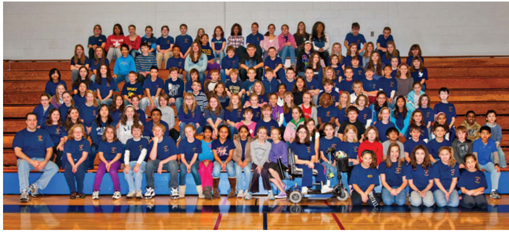
Quelques-uns des 300 membres du club OJOI étaient présents pour la photo de groupe de l'année dernière.

Cette année, chaque sac « Père Noël discret » comprenait un sac à cordonnet et un bonnet de laine offerts par le magasin de l'école ainsi que des articles de toilette recueillis plus tôt dans l'année par les membres OJOI. Ils y ont également ajouté de petits cadeaux tels des animaux en peluche, des jeux et