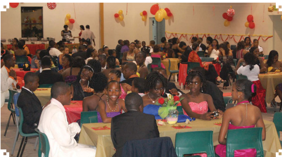
Six clubs OJOI se réunissent pour fêter sur l'île d'Anguilla.