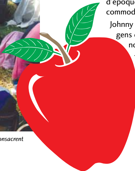
Ci-dessus : Des gourmets se laissent inspirer par l'esprit festif.