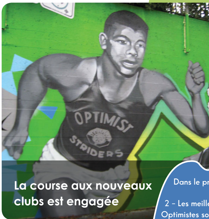
Cette peinture murale qui se trouve à Vancouver, en Colombie-Britannique, est de Harry Jerome, un Canadien médaillé de bronze olympique en athlétisme.

179: jours qui restent pour atteindre les objectifs de cette année!